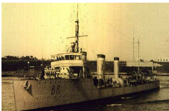
Il „Giuseppe Dezza“

Per quanto riguarda i subacquei, l'alto Adriatico è ricco di relitti facilmente raggiungibili a profondità non esagerate. Alcuni li abbiamo già visitati alcuni anni fa, altri li scopriremo con piacere. Alcuni esempi: