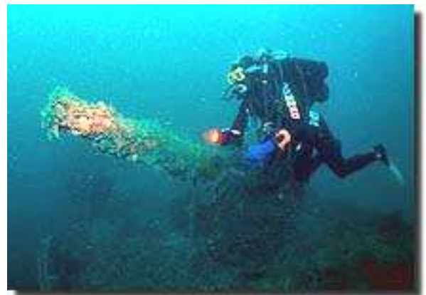
In immersione sul relitto del „Giuseppe Dezza“

Per le immersioni faremo riferimento ad una organizzazione italiana.