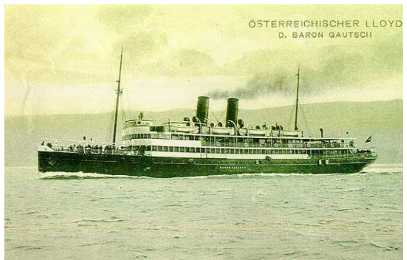
Il „Baron Gautsch“

E' possibile affrontare anche i locali di controcoverta, che si mantengono su una profondità massima di 32-33 metri. Bisogna stare attenti a non esagerare nelle penetrazioni dei locali interni nelle zone più profonde. Infatti il relitto è adagiato su un fondale sabbioso e parecchio fango è presente nelle parti interne inferiori, pronto ad essere smosso ed a togliere visibilità ed orientamento anche ai subacquei più esperti.